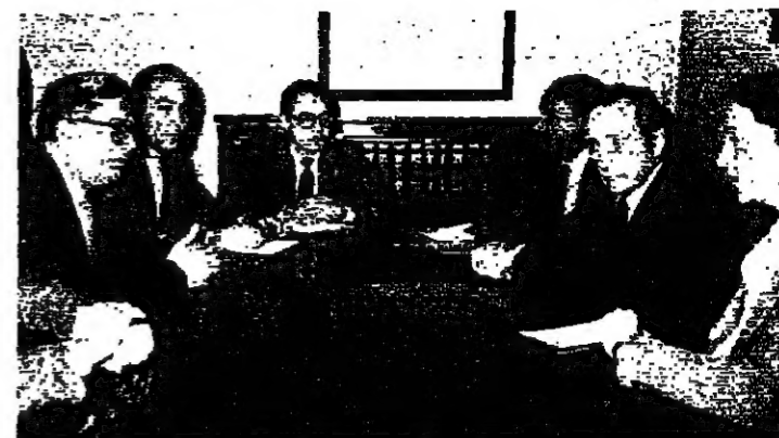
بريان اوركهارت خلال جلسة المباحثات مع السفير التركي في الخرجية